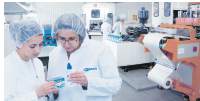
Высокотехнологичное современное производство компании «Динамика» располагается в городе Бердск Новосибирской области. Вся продукция изготавливается на итальянской производственной линии OMAG и проходит строгий контроль качества в соответствии с высочайшими стандартами.

Важно, что мы проводим серьезные клинические испытания наших продук-