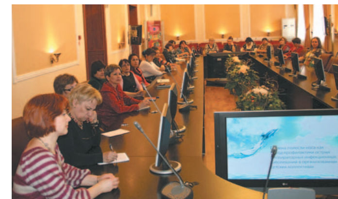
В рамках акции проходят конференции и круглые столы для практикующих врачей и администрации детских учреждений

Наибольшим успехом наша акция пользовалась в Казани. Педагоги и руководители казанских школ проявили интерес в отношении проведения профилактических мер среди своих учащихся. Мы искренне надеемся, что акция станет хорошим толчком для сотрудничества медиков и педагогов и поможет внедрить гигиену полости носа среди школьников. Мы уверены, что это поможет снизить заболеваемость ОРВИ и гриппом.