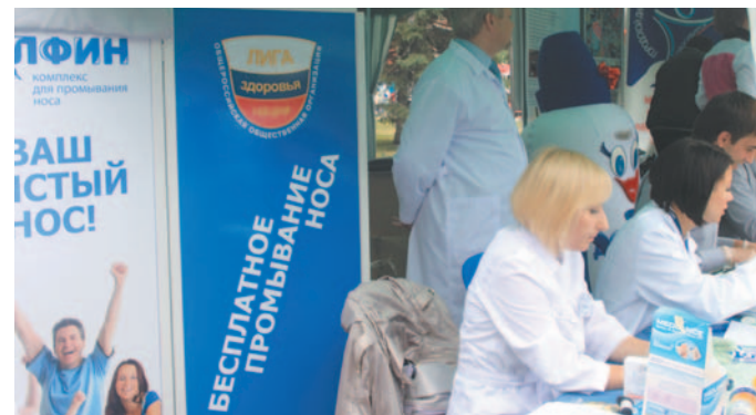
В каждом городе проходят бесплатные обучающие акции для населения

В Центральном НИИ эпидемиологии Роспотребнадзора прошла пресс-конференция на тему: «Сезон гриппа и ОРВИ 2011–2012: профилактика и диагностика инфекций». Эпидемиологи предупреждают о высокой восприимчивости населения к новому штамму.